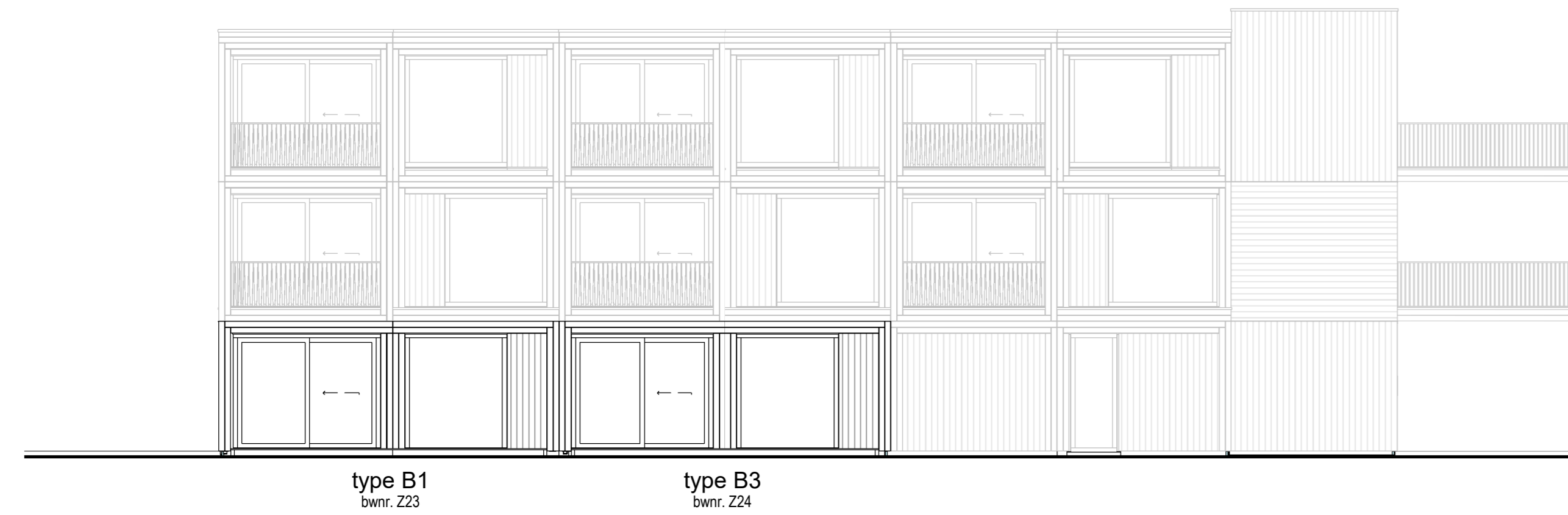
achtergevel - Zandheugel 23-24