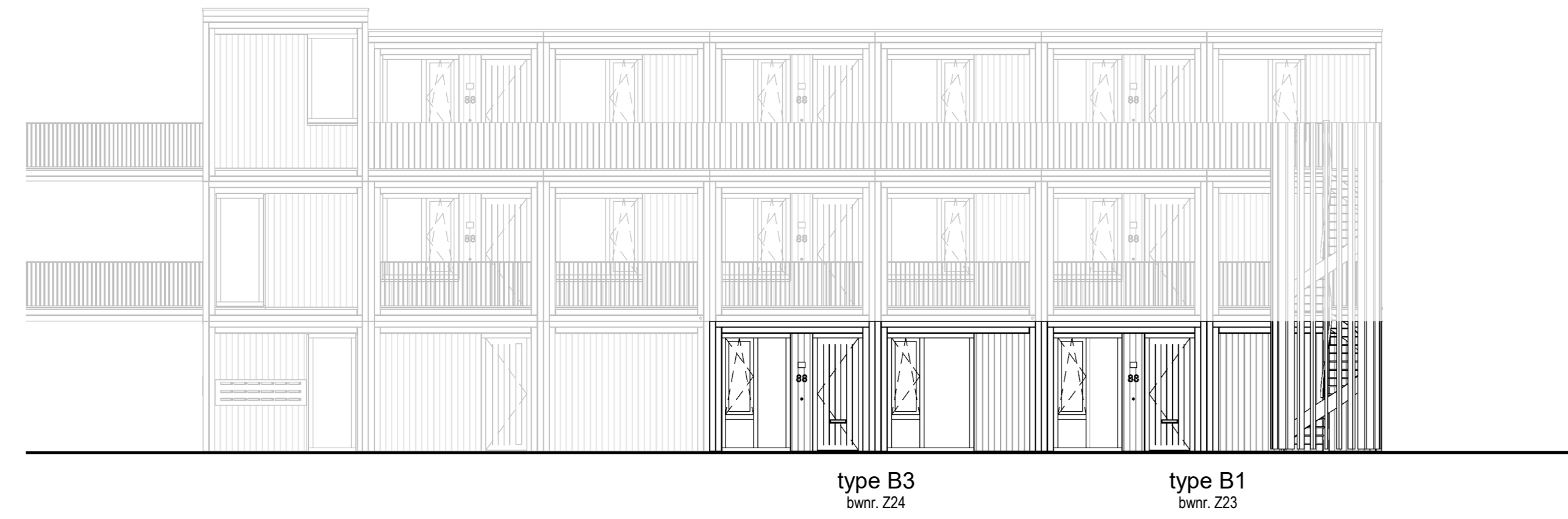
voorgevel - Zandheugel 23-24