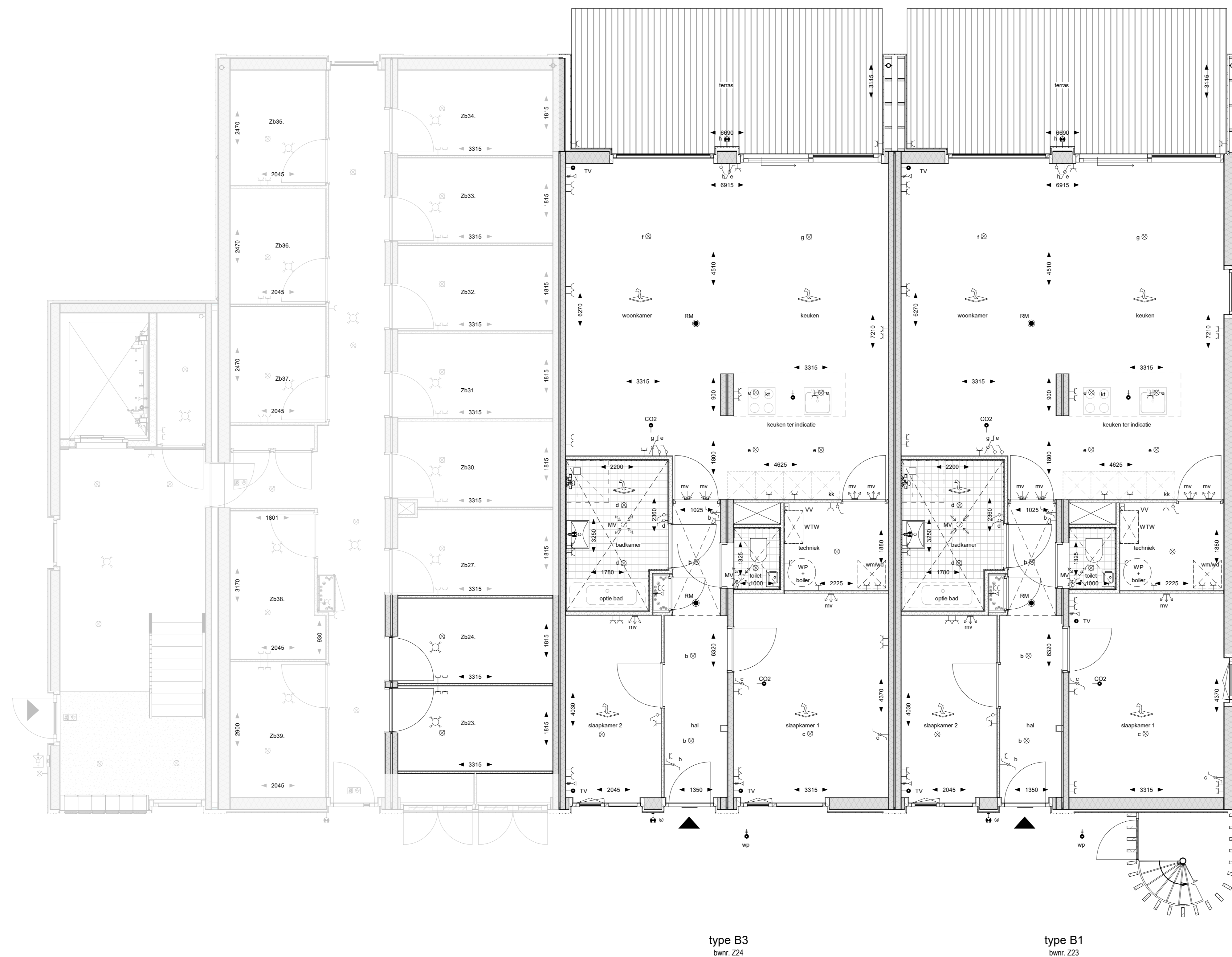
begane grond - Zandheugel 23-24