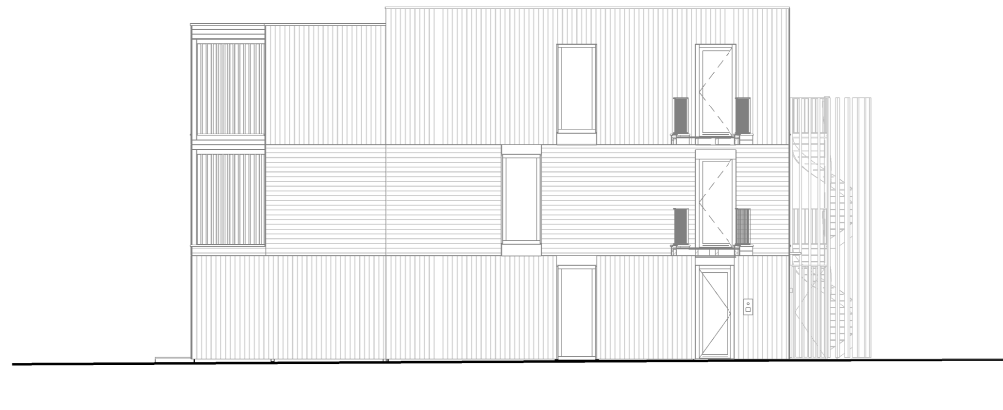
linker kopgevel - trappenhuis en bergingen