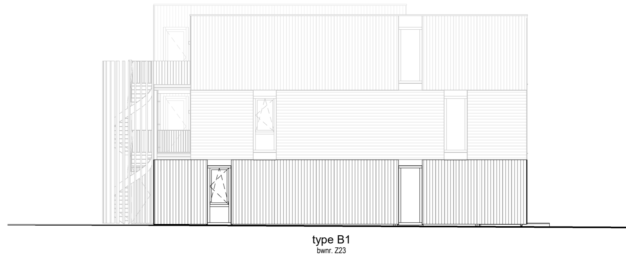
rechter zijgevel - Zandheugel 23